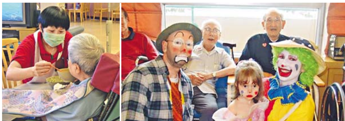
▲院舍除了為長者提供24小時貼身照顧外，亦經常舉辦多姿多采的活動，滿足他們身、心、社、靈的需要。

如欲查詢老人院舍資料，可致電2703-3373與基督教靈實協會聯絡或瀏覽 www.hohcs.org.hk 。